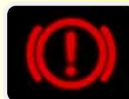
Handrem (+ remvloeistof tekort)

Van bovenstaande meters mag ALLEEN de toerenteller kapot zijn (is niet een vaste inrichtingseis voor de auto). De overige meters MOETEN werkend zijn